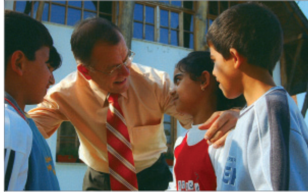
Gyenesei István gyakran találkozik roma fiatalokkal is. Nem véletlen, hogy a dél-somogyi cigányok őt támogatják az országgyűlési választásokon

tom, csorbítja azt a jelenlétet, amellyel eddig lehetőséget kaphattunk az önkormányzati érdekképviselőre. Erre is megoldást kell találni. Szeretnénk, ha minden hivatalban, intézményben lélekszámának megfelelően több cigány származású munkatárs, szakember dolgozna.